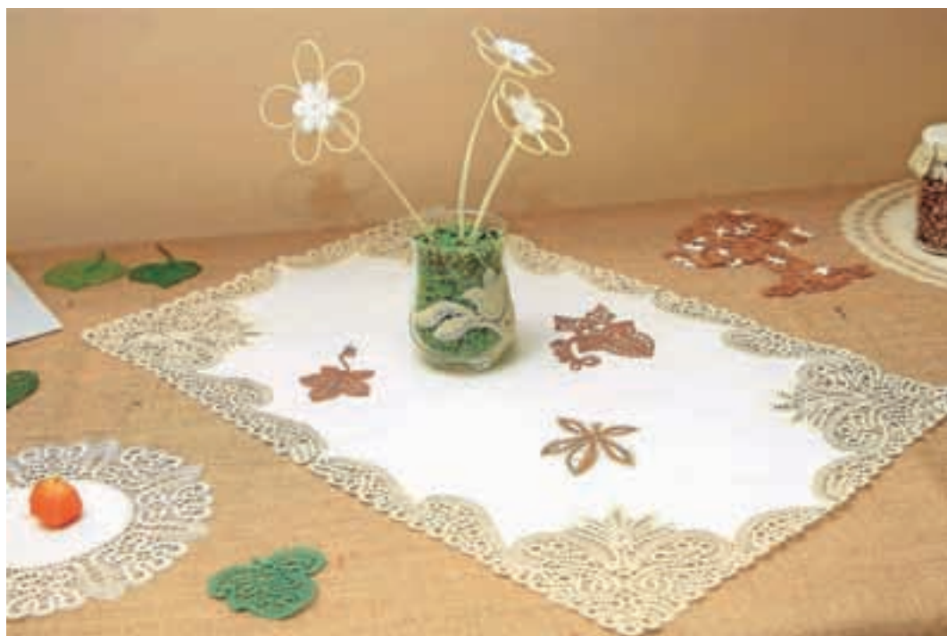
Motiv z razstave čipk