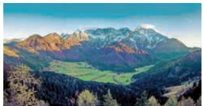
Eden od zgodnje zimskih jezerskih motivov

Skoraj hkrati kot meteorološka postaja je začela delovati in sliko z visoko ločljivostjo oddajati tudi spletna panoramska kamera. Kamera je nameščena na mesto, od koder zajema najširše vidno polje, torej prikazuje celotno jezersko dolino, vključno z Ravensko Kočno. Gre za premično kamero, ki se stalno giblje v smeri vzhod – zahod. Posebnost te kamere je tudi njena interaktivnost, torej omogoča predvajanje trenutnih vremenskih razmer, dodajanje napovednika dogodkov, predvajanje promocijskega video spota ipd. Njena slika je dosegljiva na spletnih straneh www.jezersko.info in www.jezersko.si . Želja in cilj je, da kamera postane eno glavnih orodij obveščanja obiskovalcev o trenutnih razmerah in drugih aktualnostih naše občine. Ob tej priložnosti se zahvaljujemo Petru Virniku za dovoljenje in uporabo zemljišča, kjer je kamera montirana, in Telekomu Slovenija.