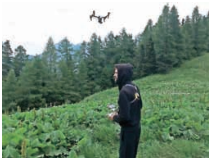
Na posnetku t. i. drone tik preden je izgubil signal