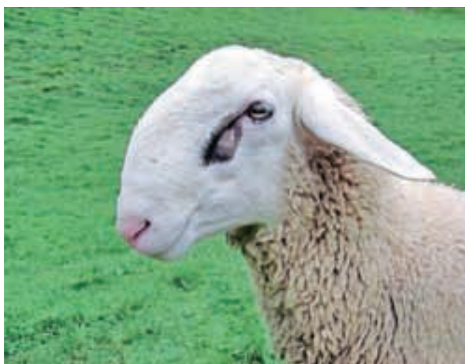
Ovca jezersko-solčavske pasme

saj je veliko povpraševanje po mleku in izdelkih iz kozjega mleka. Trenutno se zelo širi ekološka reja perutnine, reja ovc se ne povečuje. Vsi rejci, ki sodelujejo v rejskih zvezah za posamezno pasmo, plemenske živali prodajajo na dražbi, ki je v jesenskem času. Letošnje so se udeležili tudi rejci z Jezerskega. Glede ekološkega kmetovanja pa tudi njihovi rejci obupujejo nad vodenjem evidenc in plačevanjem visokih stroškov kontrole. Tudi v Avstriji število kmetij, vključenih v ekološko kontrolo, precej niha glede na pomoč države. Po dražbi je bilo prijetno druženje ob dobrotah, ki jih vsako leto pripravijo gostitelji. Letos je bilo vzdušje zaradi uspešne prodaje in tudi dobrega nakupa še bolj veselo kot sicer. Tudi vreme nam je bilo naklonjeno, saj je po deževnem tednu posijalo sonce in obsijalo pobeljene vrhove Kamniško-Savinjskih Alp.